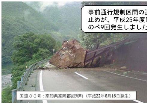
事前通行規制区間の通行止めが、平成25年度は、のべ9回発生しました。

大雨により発生する落石や土砂災害から道路利用者の皆様を守り、安全を確保することを目的として、一定の降雨量に達した場合やパトロールにより危険と判断された場合には、国道の通行止めを実施します。皆様のご理解とご協力をお願いします。