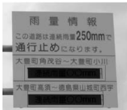
雨量規制の情報は、「通行規制」を行う区間前後の雨量広報板、道路情報板でお知らせしています。