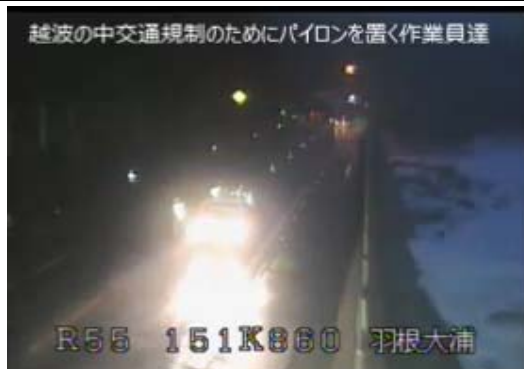
R 55 室戸市羽根の規制準備状況

http://www.skr.mlit.go.jp/tosakoku/movie/R32terauchi.mp4