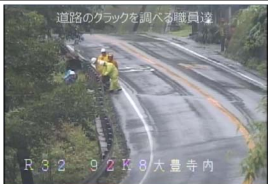
R 32 大豊町寺内の路面クラック調査状況