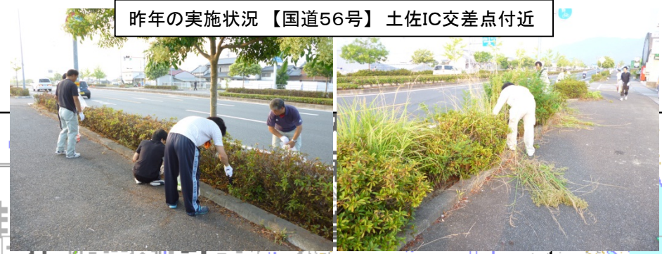
昨年の実施状況【国道56号】土佐IC交差点付近