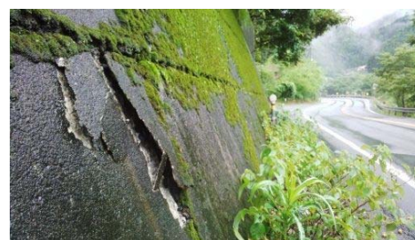
一般国道32号 大豊町大字寺内 (擁壁の被災状況)