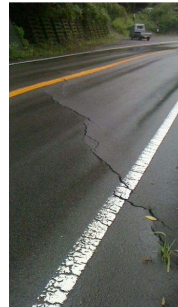
一般国道32号 大豊町大字寺内 (路面の被災状況)