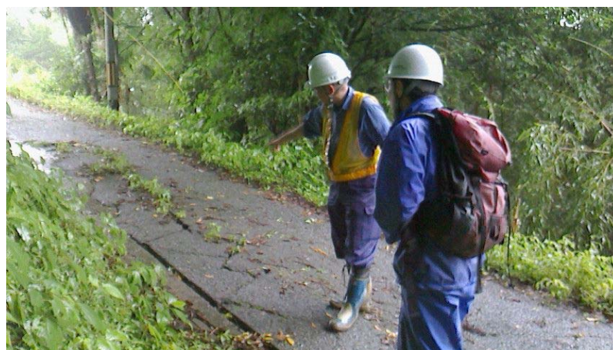
周辺法面の確認状況