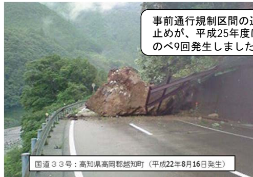
事前通行規制区間の通行止めが、平成25年度は、のべ9回発生しました。