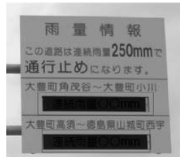
雨量規制の情報は、「通行規制」を行う区間前後の雨量広報板、道路情報板でお知らせしています。