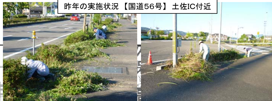
昨年の実施状況【国道56号】土佐IC付近