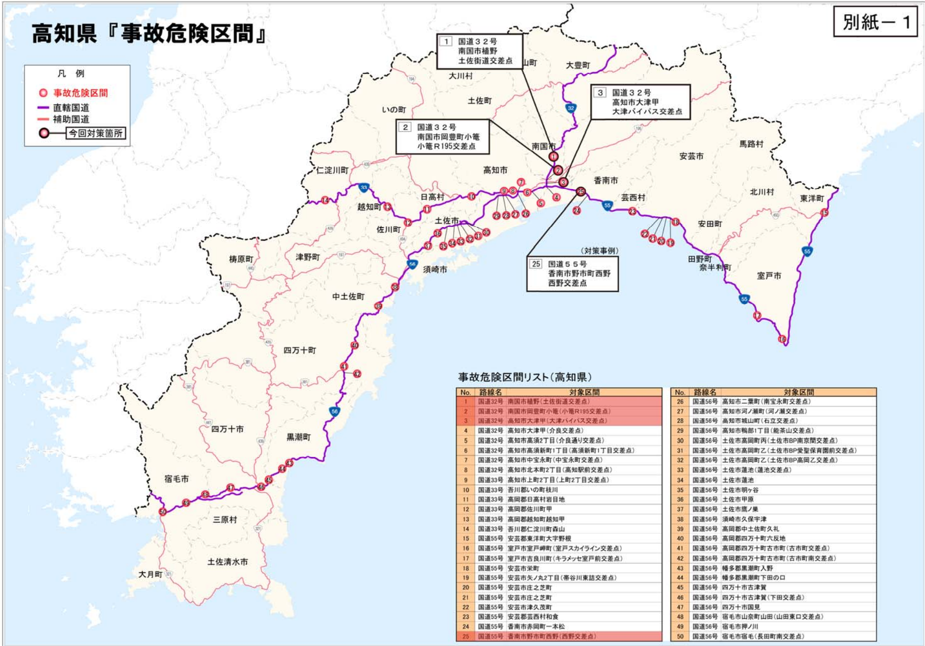
事故危険区間リスト(高知県)