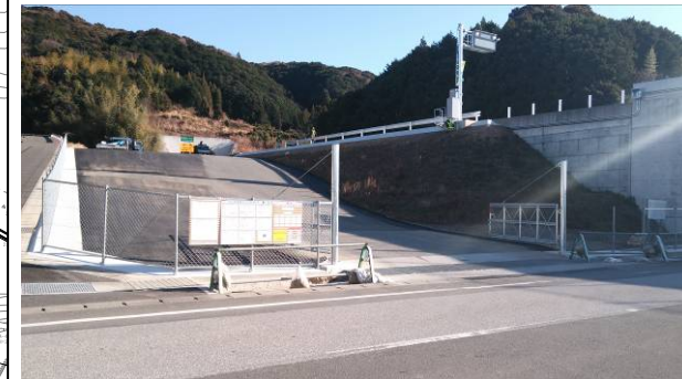
県道側から見た緊急連絡路