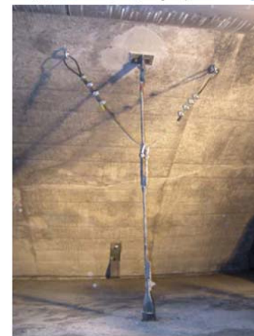
フェールセーフワイヤーによる補強状況