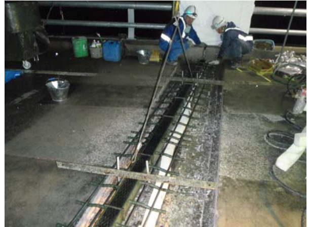
伸縮装置の取替状況(例)