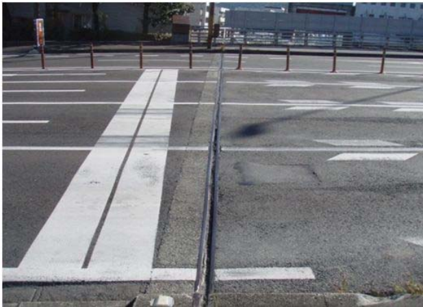
伸縮装置の損傷状況

国道56号 鏡川大橋は1981年に架設された橋梁であり、架設後31年を経過しています。橋梁点検の結果、伸縮装置部の劣化が進行しているため、今回の工事で伸縮装置の取替を行い、橋梁本体への雨水等の流入を防ぐことにより、橋梁の長寿命化を図ります。