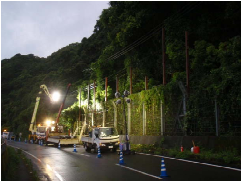
【H型鋼建て込み（夜間）】