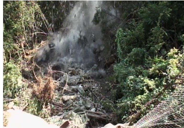
不安定岩塊を発破により除去