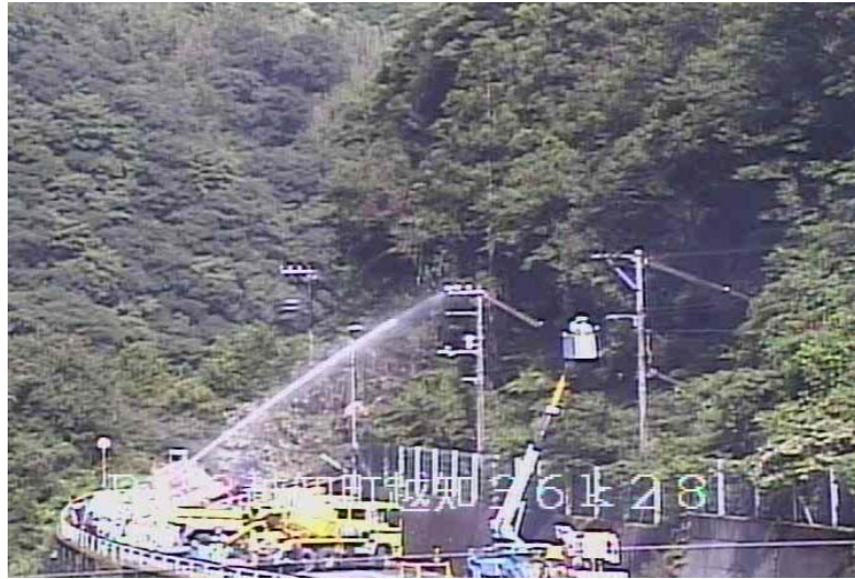
不安定岩塊を放水により除去中