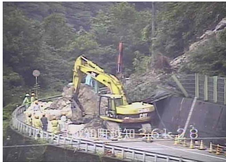
落下した岩塊の小割り作業実施中