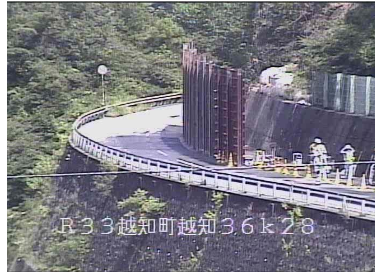
片側交互通行による交通開放