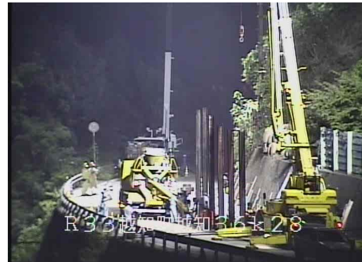
仮設防護柵（高さ5m）の設置中