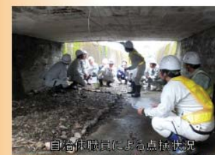
自治体職員による点検状況 【点検箇所：市道 地蔵原明神木線 地蔵原北橋】