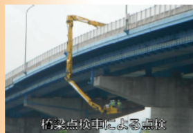
橋梁点検車による点検

橋梁は様々な部位・部材で構成されており、普段通る橋面上からは見えないところにも、橋を支える重要な部位・部材があります。5年に1度の近接目視による点検では、橋の下面まで入り、触診や打音検査を行い、損傷度合いについて診断を行います。