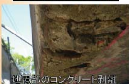
地盤部のコンクリート剥離