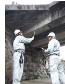
自治体職員による点検状況 【点検箇所：町道 菊楽線 菊楽橋】