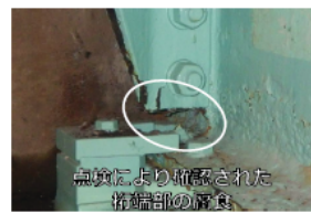
点検により確認された 桁端部の腐食