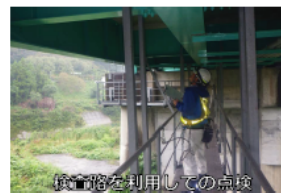
検査路を利用した点検