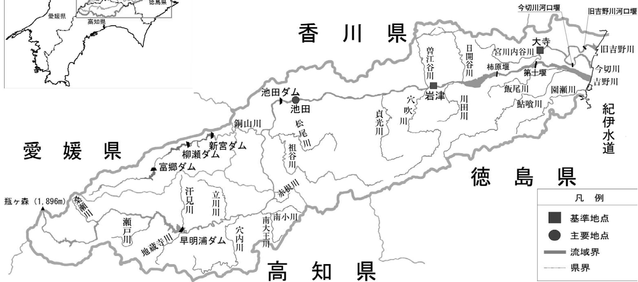
(参考図) 吉野川水系図