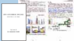
吉野川水系河川整備計画【再修正素案】

国土交通省の関係機関及び各市町村の窓口で閲覧いただけるほか、ホームページ( http://www.yoshinoriver.info )からダウンロードすることもできます。