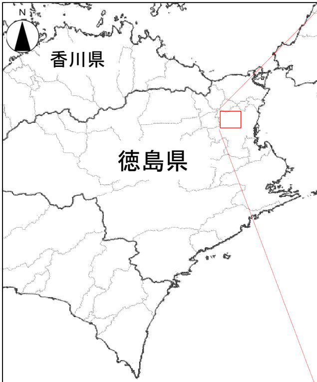
この地図は、国土地理院の地理院地図に加筆したものである。

令和6年4月8日に、一般国道192号 徳島南環状道路 僧津山トンネルの掘削を開始します。