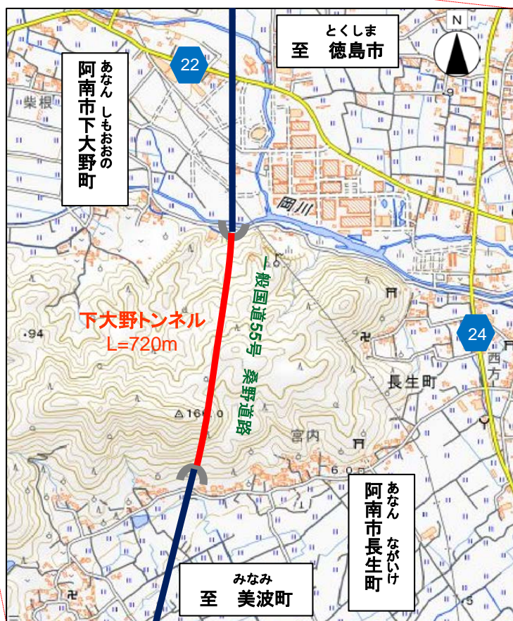
この地図は、国土地理院の地理院地図に加筆したものである。

下大野トンネルは徳島県阿南市下大野町～長生町に位置し、一般国道55号桑野道路を構成するトンネルの一つで、延長はL=720mです。