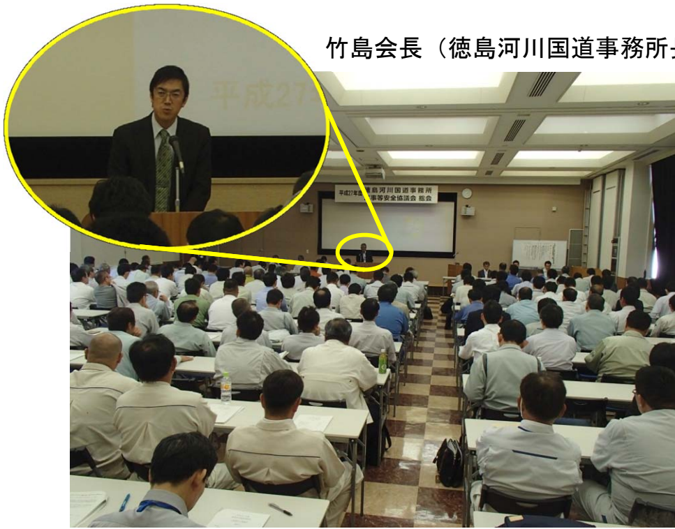
竹島会長（徳島河川国道事務所長）