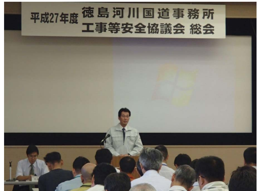
橋本交通規制課指導官