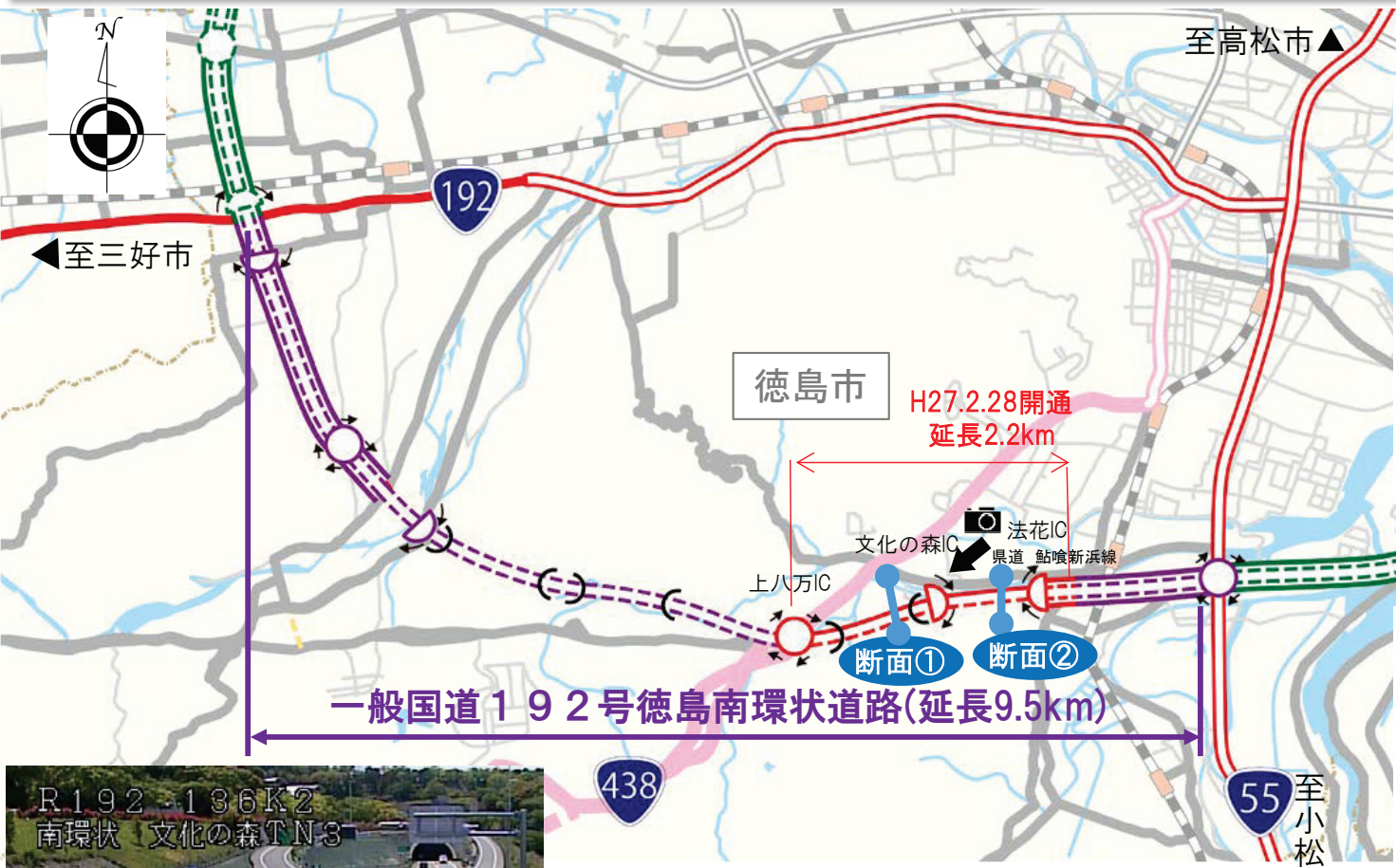
断面① 上八万IC～文化の森IC