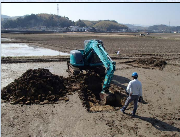
重機による試掘調査

「この地図は、国土地理院長の承認を得て、同院発行の5万分の1地形図を複製したものである。（承認番号 平17四復、第150号）」