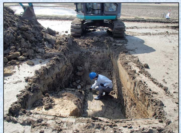
手掘りによる試掘調査