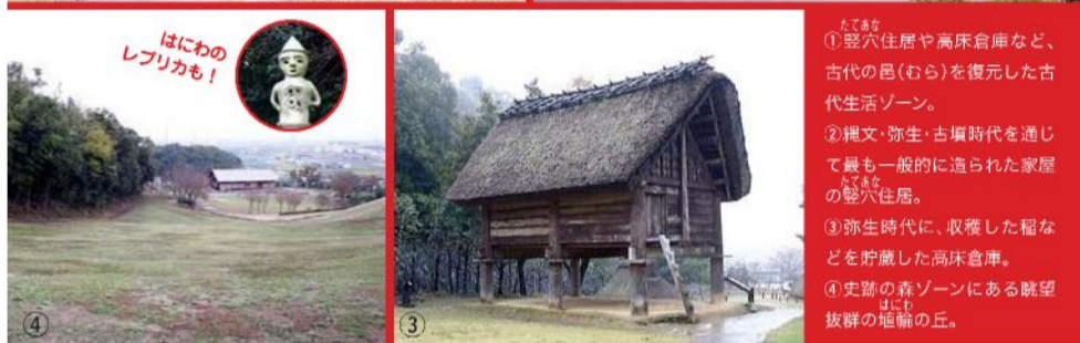
① 竪穴住居や高床倉庫など、古代の邑(むら)を復元した古代生活ゾーン。 ② 縄文・弥生・古墳時代を通じて最も一般的に造られた家屋の竪穴住居。 ③ 弥生時代に、収穫した稲などを貯蔵した高床倉庫。 ④ 史跡の森ゾーンにある眺望抜群の堀原の丘。

文化財や歴史文化遺産が数多く点在し、豊かな自然にも恵まれた国府町西矢野エリア。そのシンボリックな存在となっているのが、平成5年にオープンした「阿波史跡公園」です。約6万5000平方メートルの広大な園内は、古代の邑を復元した「古代生活」、古墳や城跡が残る「史跡の森」、考古資料館もある「歴史文化」、野草などに親しめる「自然体験」と、テーマ別に4つのゾーンで構成。中でも一際と目を引くのが古代生活ゾーン内にある2棟の竪穴住居と高床倉庫。古代生活を体感する2棟の竪穴住居で、徳島市内の発掘調査をもとに復元されました。7×7メートルと6×5・6メートルの大きさを主柱は4本あり、建築材には檜などの広葉樹を使用。屋根には冷害に強い青森産の葺いで葺いています。他にも、床面積が一般的なものに比べて約3〜4倍もあるという高床倉庫や、徳島市内を一望できる前方後円墳の宮谷古墳など、地域が育んだお宝がいっぱい。緑豊かな遊歩道に沿って、散歩気分を味わってはいかがですか？