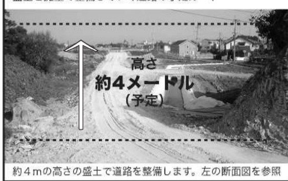
約4mの高さの盛土で道路を整備します。左の断面図を参照