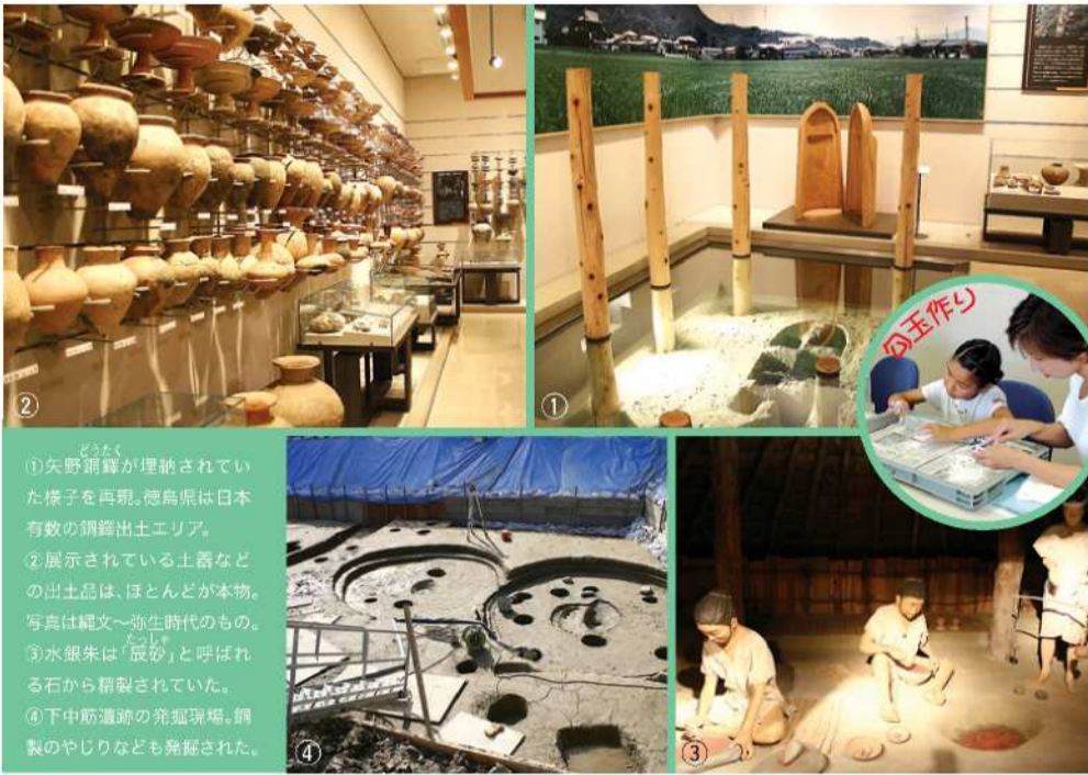
①矢野浦跡が埋納されていた様子を再現。徳島県は日本有数の銅鑄出土エリア。 ②展示されている土器などの出土品は、ほとんどが本物。写真は縄文～弥生時代のもの。 ③水銀朱は「辰砂」と呼ばれる石から精製されていた。 ④下中筋遺跡の発掘現場。銅製のやじりなども発掘された。

本物の土器に触れられる！ 今回のお宝ウオッチは、徳島県で発掘された土器や木簡など、旧石器時代から中世までの各種遺物が展示される「徳島県立埋蔵文化財総合センター」へ行ってきました。エントランスに並び、10を超える銅鑄(レプリカ)を潜り抜け、館内展示室に足を踏み入れると、ありますあります！教科書などでしか見たことのない埋蔵文化財が、時代別にズラリ。中でも銅鑄の埋納を再現した「矢野銅鑄埋納坑」、壜穴式住居の中での水銀朱精製の様子を復元したブース。また、屋外に展示された古墳の石室は 圧巻です。もちろん、下で紹介している下中筋遺跡(上八万町)から出土したガラス製の勾玉など、徳島南環状道路の工事現場から発掘された遺物もこちらで展示(勾玉は今後展示される予定)。また、お宝を見るだけではなく、本物の土器などに触れたり、勾玉作りに挑戦できる実習室もあり、楽しみながら歴史の勉強ができます。「作った勾玉は、お土産にどうぞ」とはセンターのスタッフ。お宝と気軽に親しめる徳島県立埋蔵文化財総合センターへ、ご家族みなで訪れてみてはいかがでしょうか？