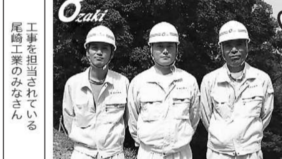
工事を担当されている尾崎工業のみなさん

Q 工事はいつまで続くのですか？ A 平成19年3月31日まで工事を予定しています。