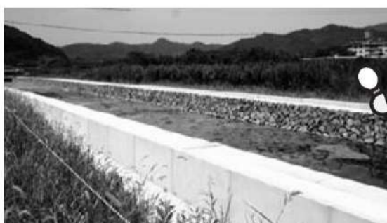
平成17年度に完成した護岸ブロック