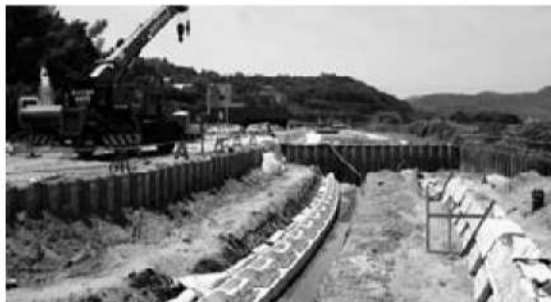
星河内谷川の護岸ブロック施工工事の様子