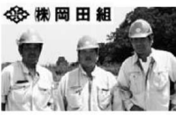
工事を担当されている岡田組のみなさん

護岸の裏に新設の水道管が入る予定です。工事の順序は、水道管が入る護岸の半分を先に仕上げ、次に水道局が水道管を通し、そして残りの護岸を施工していく形になります。