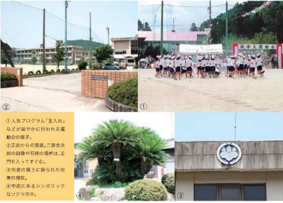
①人気プログラム「玉入れ」などが賑やかに行われる運動会の様子。 ②正面からの風景。二宮金次郎の銅像や石碑の場所は、正門を入ってすぐ右。 ③校舎の屋上に飾られた校章の桐紋。 ④中庭にあるシンボリックなソデツの木。

土社会を愛し、豊かな心で気づき・考え・行動し、国際社会の一員として生きる力を備えた児童を育成する」という教育目標のもと、約400人の児童が元気に通っています。そんな上八万小学校のお宝は、創立時の校名「惜陰」の文字が刻まれた石碑に、さまざまな自然体験学習が行われる緑豊かな学校林など、スケールの大きなものがズラリ。もちろん、どれも児童に親しまれ、卒業後は大切な思い出になる貴重なお宝ばかりです。