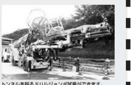
トンネルを掘るドリルジャボ試乗ができます。