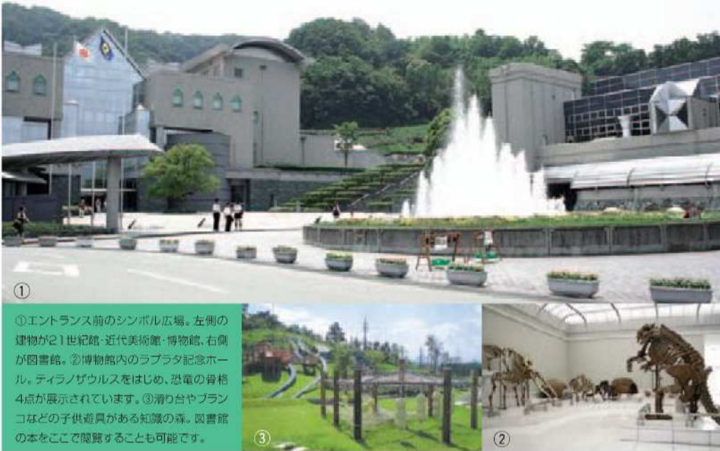
① エントランス前のシンボル広場。左側の建物が21世紀館・近代美術館・博物館、右側が図書館。② 博物館内のラプラタ記念ホール。ティラノザウルスをはじめ、恐竜の骨格4点が展示されています。③ 滑り台やブランコなどの子供遊具がある知識の森。図書館の本をここで閲覧することも可能です。

また、施設の周りには知識・創造など4つのテーマの森を、バランスよく配置。合わせて施設と森とを散策路で一体的に結び、園全体をひとつの展示室空間として機能させている点もポイントです。