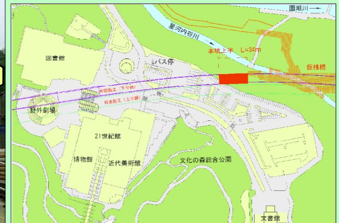
トンネル位置図(平成18年6月30日現在)

法花トンネルのホームページが開設されています。 アクセス方法は、 徳島河川国道事務所 ( http://www.toku-mlit.go.jp/ ) に アクセスし、 ・道路資料館→工事現場ガイド→法花トンネル工事 の順にクリックして下さい。法花トンネル工事の詳細な情報 が得られます。