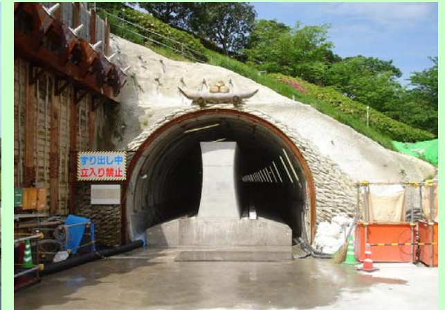
センターピラーコンクリート(中央導坑)完成

法花トンネルのホームページが開設されました。 アクセス方法は、 徳島河川国道事務所 ( http://www.toku-mlit.go.jp/ ) にアクセスし、 ・道路資料館→工事現場ガイド→法花トンネル工事 の順にクリックして下さい。法花トンネル工事の詳細な情報が得られます。