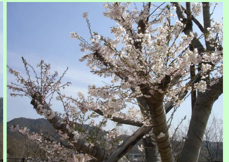
桜開花状況(平成18年4月6日撮影) (徳島県立総合教育センター(板野町))

法花トンネルのホームページが開設されました。 アクセス方法は、 徳島河川国道事務所( Http://www.toku-mlit.go.jp/ ) にアクセスし、 ・道路資料館→工事現場ガイド→法花トンネル工事 の順にクリックして下さい。法花トンネル工事の詳しい 情報が得られます。