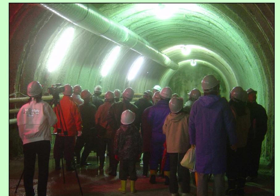
トンネルの説明(於:側壁導坑)

法花トンネルのホームページが開設されました。アクセス方法は、徳島河川国道事務所 ( Http://www.toku-mlit.go.jp/ ) にアクセスし、 ・道路資料館 ・工事現場ガイド ・法花トンネル工事の順にクリックして下さい。法花トンネル工事の詳しい情報が得られます。