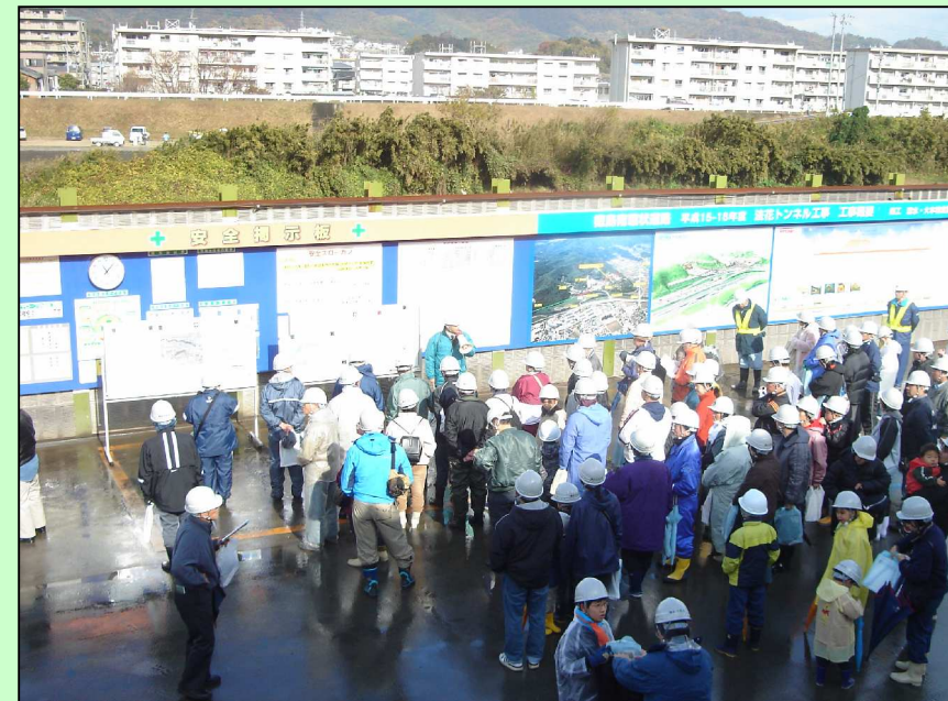
工事内容の説明(於:仮橋)