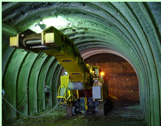
中央導坑掘削状況(シャロウダー)