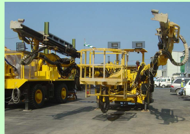
切羽(地山)に削孔する機械(油圧ジャンボ)

法花トンネルのホームページが開設されました。 アクセス方法は、 徳島河川国道事務所 ( http://www.toku-mlit.go.jp/ ) にアクセスし、 ・道路資料館 ・工事現場ガイド ・法花トンネル工事 の順にクリックして下さい。法花トンネル工事の詳細な 情報が得られます。