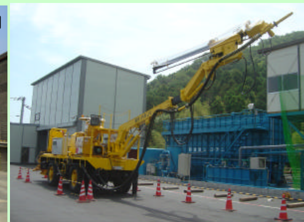
トンネルにコンクリートを吹付ける機械(吹付機)

法花トンネルのホームページが開設されました。 アクセス方法は、 徳島河川国道事務所 ( http://www.toku-mlit.go.jp/ )に アクセスし、 道路資料館 ・工事現場ガイド 法花トンネル工事 の順にクリックして下さい。法花トンネル工事の詳しい 情報が得られます。