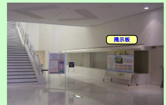
図書館 1階に掲示板を設置 (「徳島南環状道路および法花トンネルの概要」を掲示)

発注者 国土交通省 四国地方整備局 徳島河川国道事務所 連絡先 徳島建設監督官詰所 088-669-6090