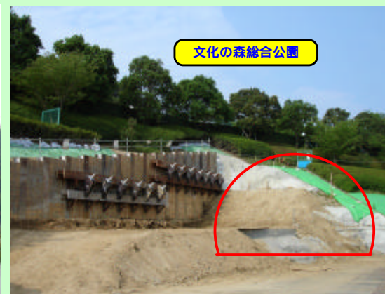
トンネル入口 (イメージ)