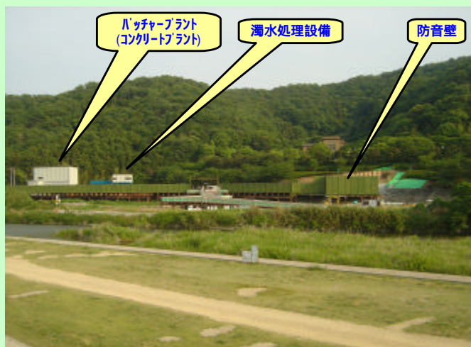
仮栈橋全景 (瀨川対岸堤防より撮影)

公園利用者の皆様にはご迷惑をお掛けしますが、徳島市中心部の渋滞緩和に向け、引き続き、ご理解、ご協力をお願いいたします。