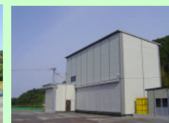
ハッチャープラント(コンクリートプラント) トンネル工事で使用するコンクリート を製造する設備

発注者：国土交通省 四国地方整備局 徳島河川国道事務所 連絡先：徳島建設監督官詰所 088-669-6090