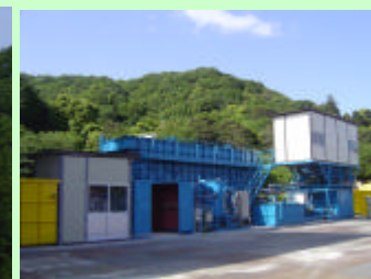
濁水処理設備 工事で発生する水をきれいな 水に処理して排水する設備