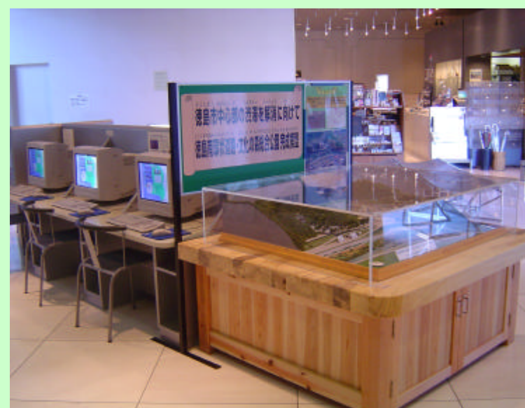
模型展示 (21世紀館情報プラザ)

「徳島南環状道路・文化の森総合公園完成模型」を、21世紀館1階の情報プラザに展示しています。 「徳島南環状道路・法花トンネル工事の概要」を図書館1階のエントランスに設置されている掲示板に掲示しています。 お気軽に、お立ち寄りください。