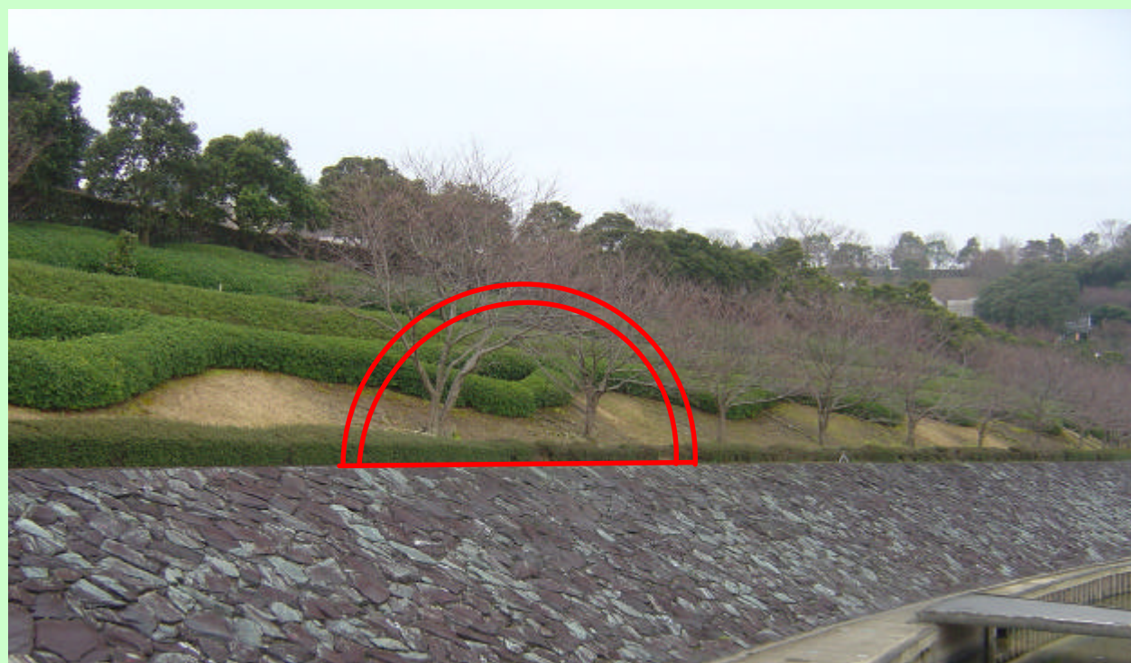
法花トンネル坑口イメージ

河川側ののり面に植樹されている桜、サツ及びツツの一部を、トンネルを施工するために、移植します。 桜（3本）は徳島県立総合教育センター（板野町）に、サツ及びツツは文化の森総合公園内に移植します。