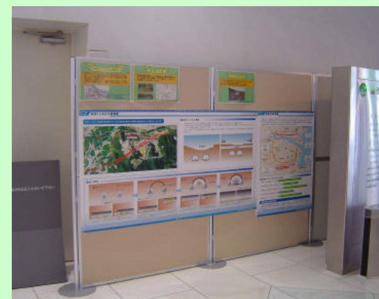
掲示板 (図書館エントランス)

発注者 国土交通省 四国地方整備局 徳島河川国道事務所 工事案内 http://www.toku-mlit.go.jp/jimusyo/virtual/ 施工者 清水・大本特定建設工事共同企業体