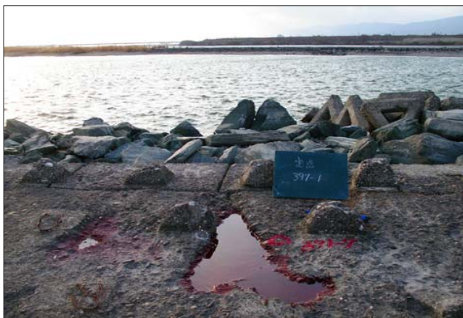
4-6 (調査位置番号 : 391-7)