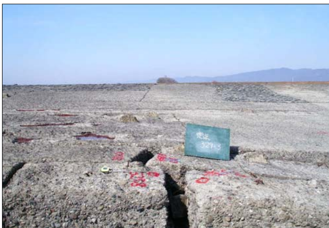
4-2 (調査位置番号 : 329-3)