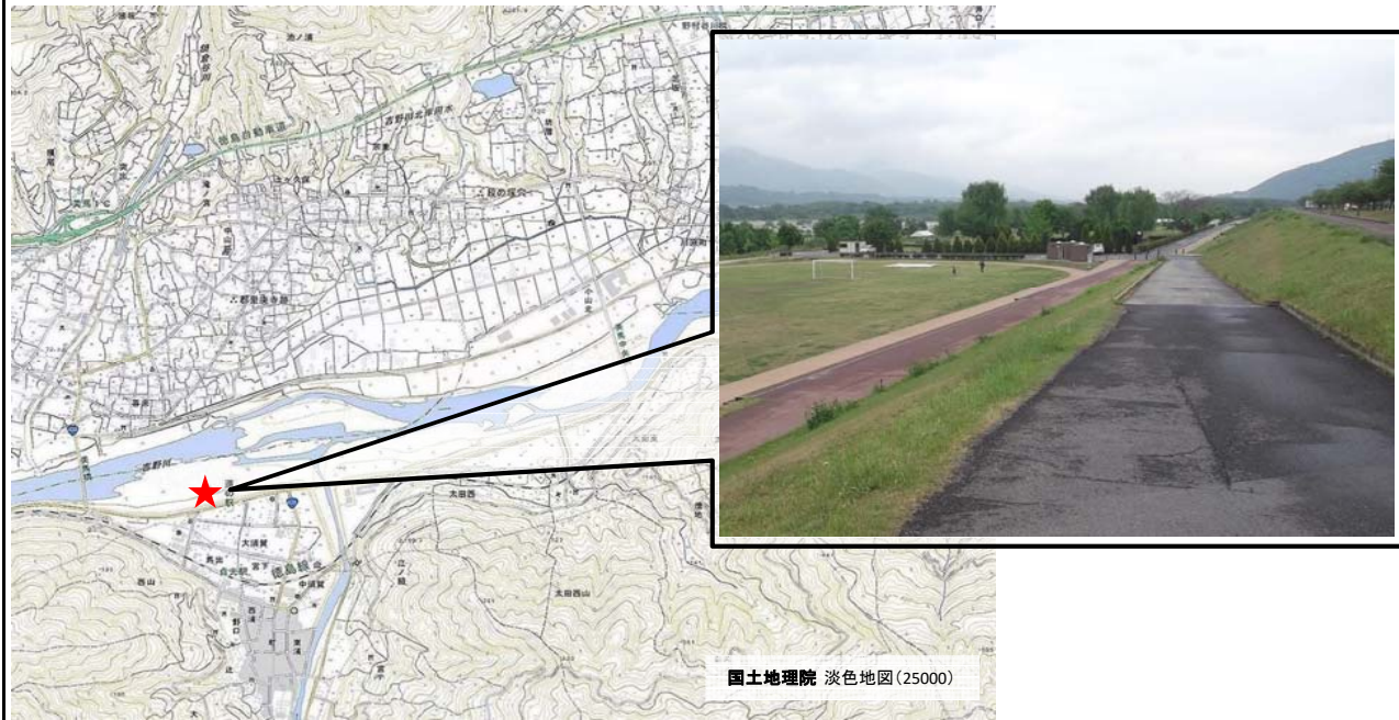
国土地理院 淡色地図(25000)