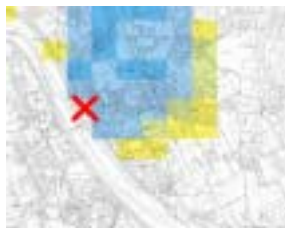
破堤箇所 1 の最大浸水区域および浸水深

氾濫計算（河道追跡計算，破堤流入量計算，氾濫流追跡計算の組み合わせ）を行うことにより，下図のようなある想定洪水，想定破堤による氾濫区域図を作成することができます。また，多数の想定破堤における氾濫区域図を重ね合わせることで最大区域図及び最大浸水深図を作成することができます。