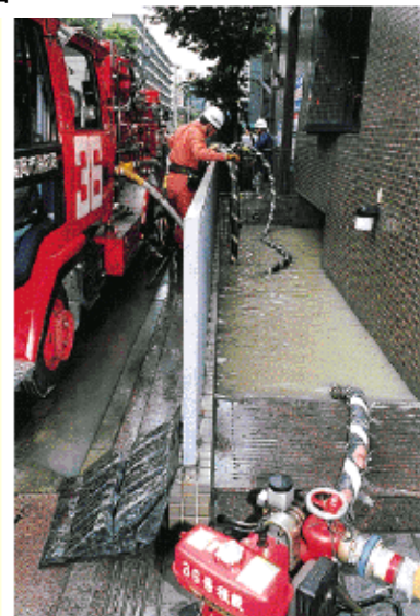
建設白書 2000 より