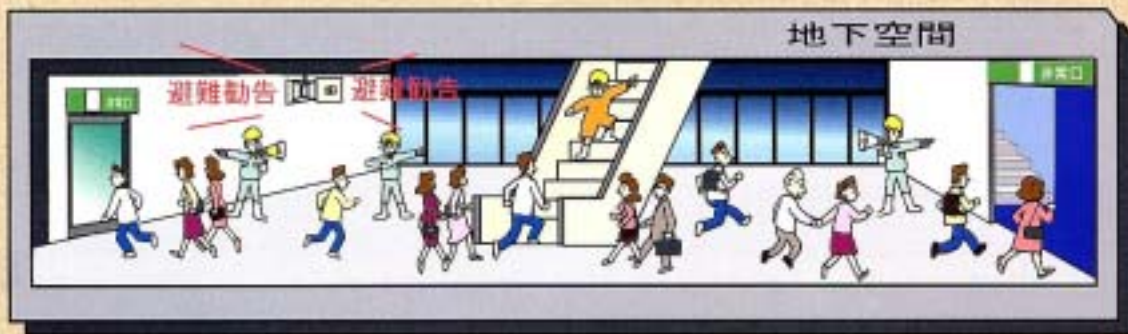
平成 11 年 6 月 29 日福岡水害