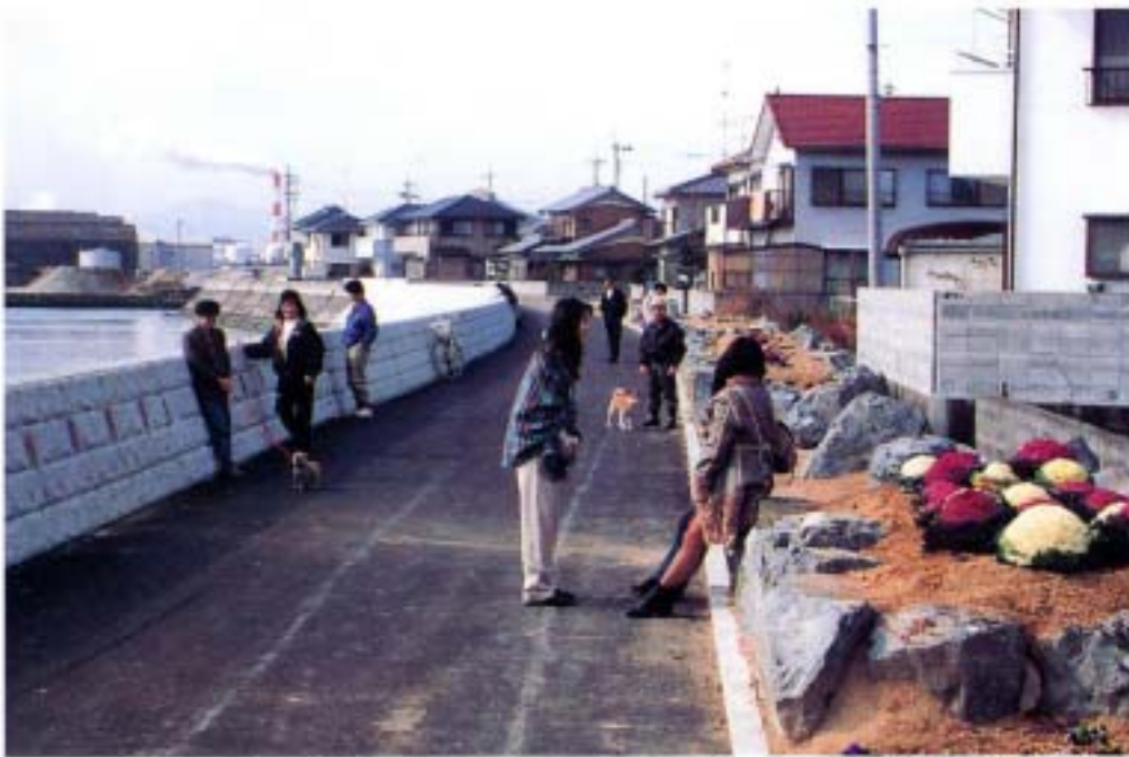
百手堤防完成写真