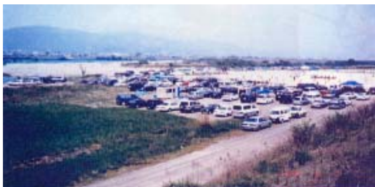
スポーツ大会会場（鴨島町内 鴨島県民運動場）