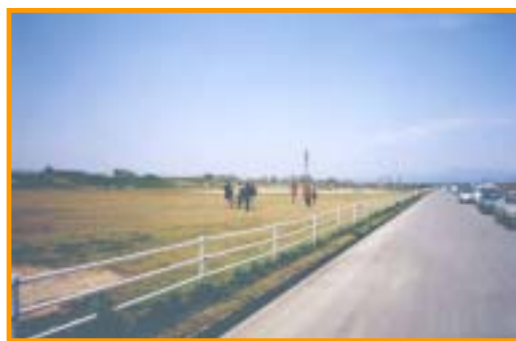
徳島市内 徳島市民吉野川運動広場