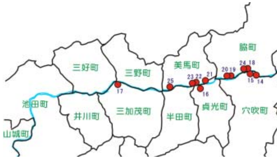
地点 1 6