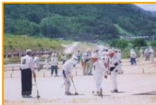
貞光町内 吉野川河川敷公園