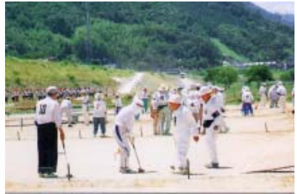
サッカー大会会場（徳島市内 徳島市民吉野川運動広場） ゲートボール場（貞光町内 貞吉野川河川敷公園）