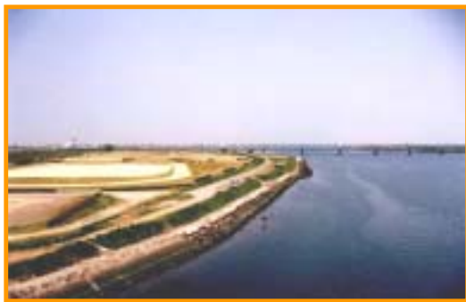
北島町内 吉野川河川敷緑地