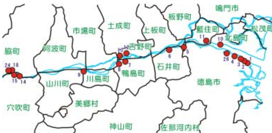
地点 2 6