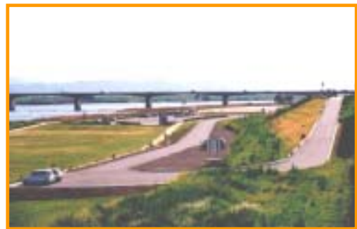
藍住町内 吉野川河川敷緑地