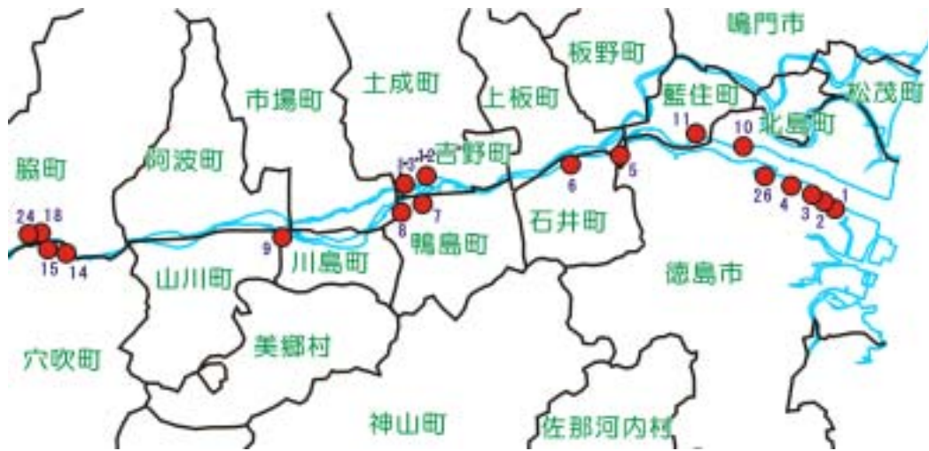
地点 1 0