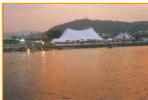
徳島市内 徳島市民吉野川運動広場