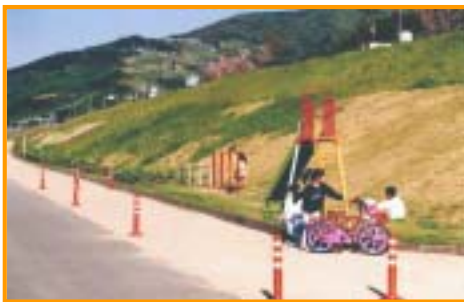
貞光町内 吉野川河川敷公園