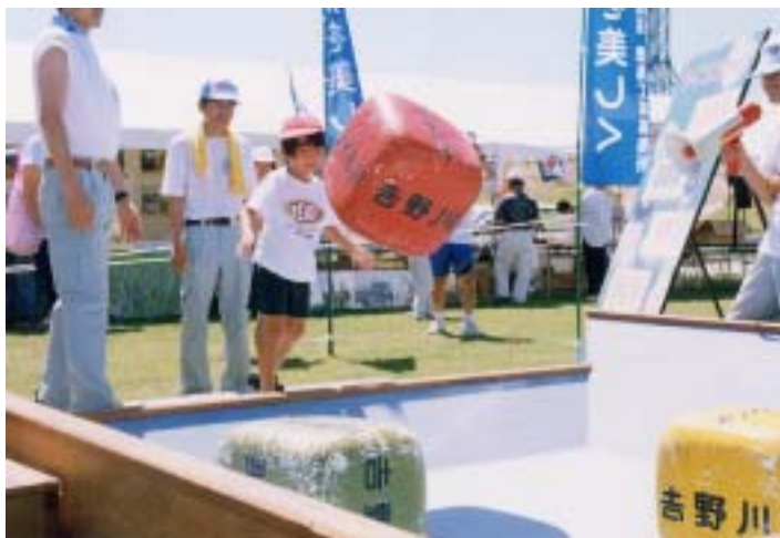
吉野川フェスティバル会場（徳島市内 徳島市民吉野川運動広場）