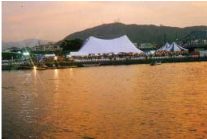
吉野川フェスティバル会場（徳島市内 徳島市民吉野川運動広場）

公園・運動場は、吉野川フェスティバル等のイベントや、サッカー等のスポーツ大会会場として、また、阿波踊り等の駐車場としても利用されています。以降では、河川水辺の国勢調査の一環として実施している「平成12年度 空間利用実態調査」結果を基に、吉野川の利用状況を紹介します。