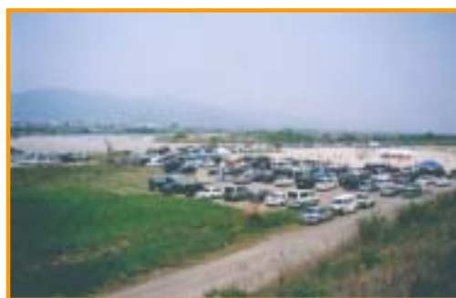
鴨島町内 鴨島県民運動場