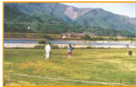
貞光町内 吉野川河川敷公園