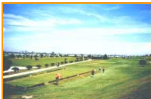
徳島市内 徳島ゴルフ倶楽部