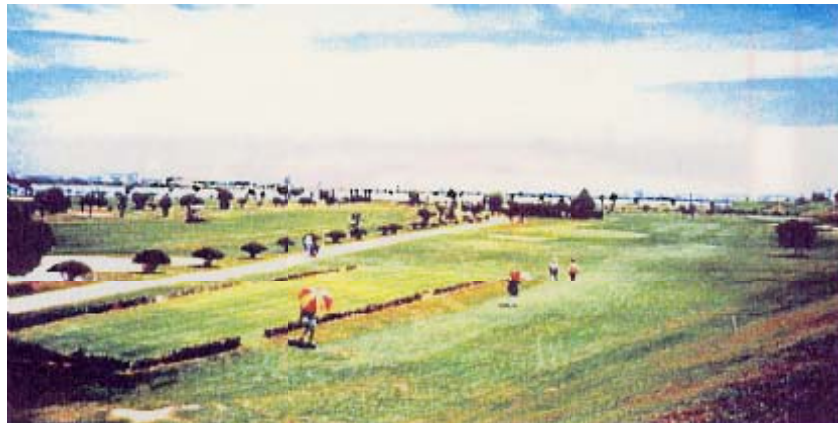
ゴルフ場（徳島市内 徳島ゴルフ倶楽部）