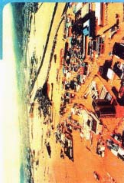
▲平成10年9月の高松市中東部を襲った集中豪雨により冠水し、洪水に町を占拠されてしまった高松市東部