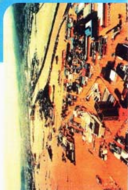
▲平成10年9月の高知県中実郡を襲った集中豪雨により冠水し、泥水に町を占拠されてしまった高知市東部（高知高野団地）