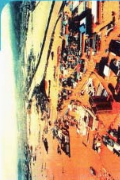
▲平成10年9月の高知県中津郡を襲った豪雨で、現場により冠水し、泥水に町を占拠されてしまった高知市東部