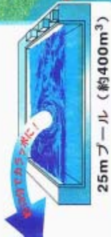
25mプール（約400m 3 ）

排水ポンプ・取水ポンプは、軽量、コンパクトな構造になっており悪天候等でクレーンを使用できない場合でも、人力で簡単に設置できます。