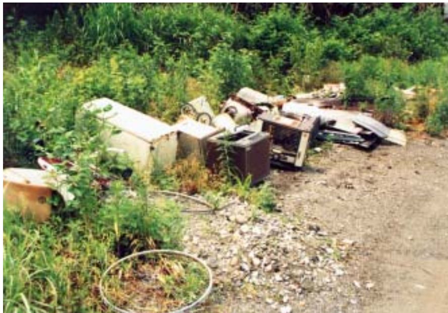
不法投棄された家電製品4品目