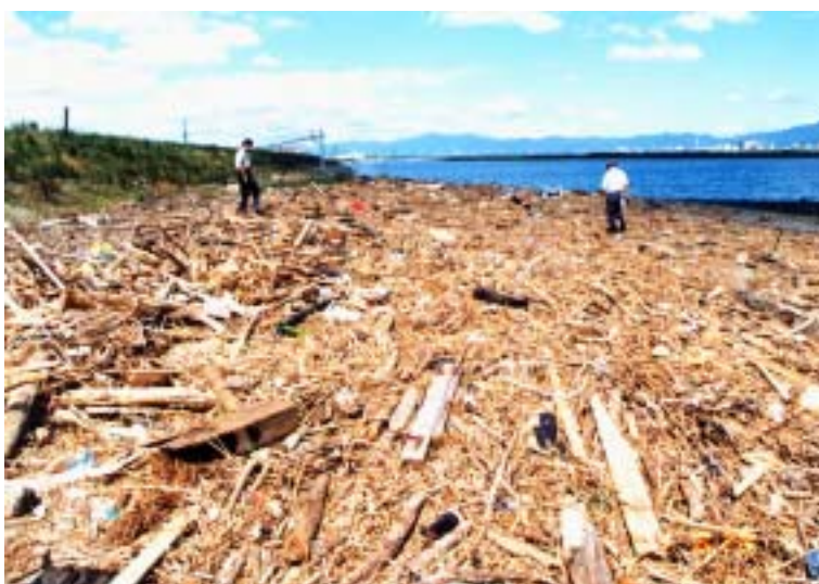
出水後、吉野川河口に漂着したゴミの山

徳島工事事務所では毎年、7月に河川一斉清掃を実施していますし、吉野川フェスティバルにおいて新町川を守る会とも協力して吉野川クリーンアップ大作戦を実施しています。他にもアドプト・プログラム吉野川でボランティアの方々の手を借りて清掃作業にも取り組んだり、目に余るゴミについては随時処分しておりますがゴミの減量には至っておりません。これらにかかる経費は決して馬鹿にできるものではありません。河川環境上も由々しき問題だと思っています。例えば、写真にあるように出水の後には大量のゴミが漂着しますが、このゴミもよく見て頂ければお解りのように流木や葦（ヨシともアシとも言う）に混じってかなりな量の家庭ゴミが含まれています。この為にゴミの分別といった余分な作業が必要となり余分な経費がかかる事になります。本来、川にはゴミは無いはずで、一朝一夕にゴミ問題が片づくものではないことは十分承知致しておりますが、ゴミの減量化にご協力頂けますようお願い申し上げます。