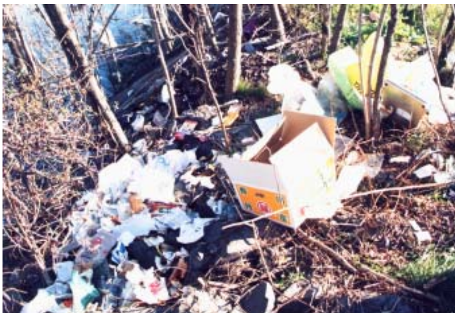
不法投棄されたゴミの山