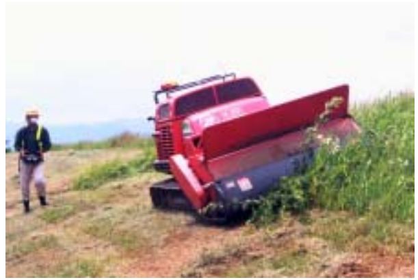
ラジコン草刈車による草刈状況