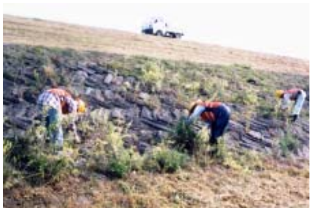
護岸部等は、人力により行います