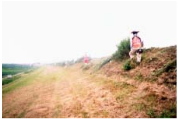
道路の近くや構造物周辺の草刈状況