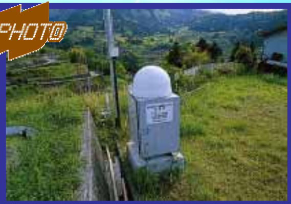
GPSによる斜面監視装置(怒田・八畝地区)