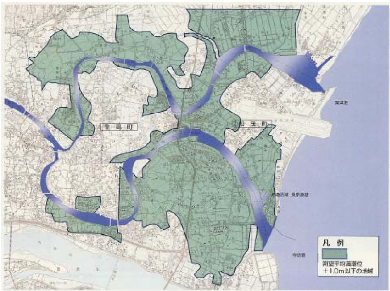
旧吉野川近傍の地盤高

旧吉野川近傍は、朔望平均満潮位 + 1 . 0 m以下の土地が広範に広がっている。