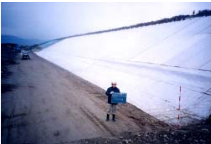
遮水シートの施工状況