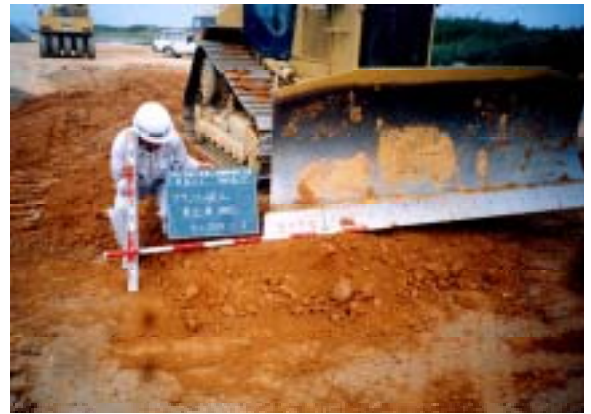
ブランケットの施工状況