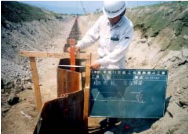
遮水矢板の施工状況