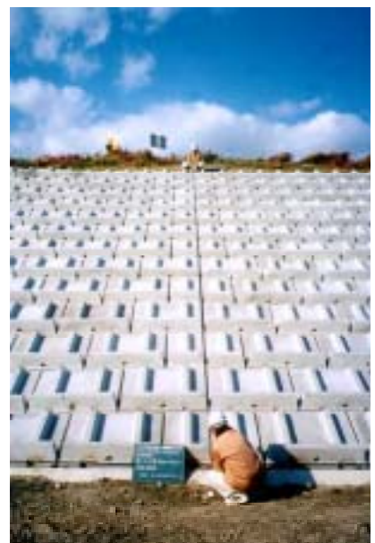
護岸ブロックの施工状況