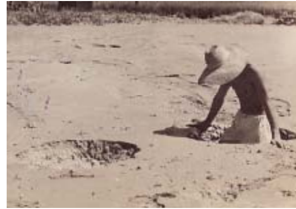
漏水により堤内の農地にガマが出来ている。