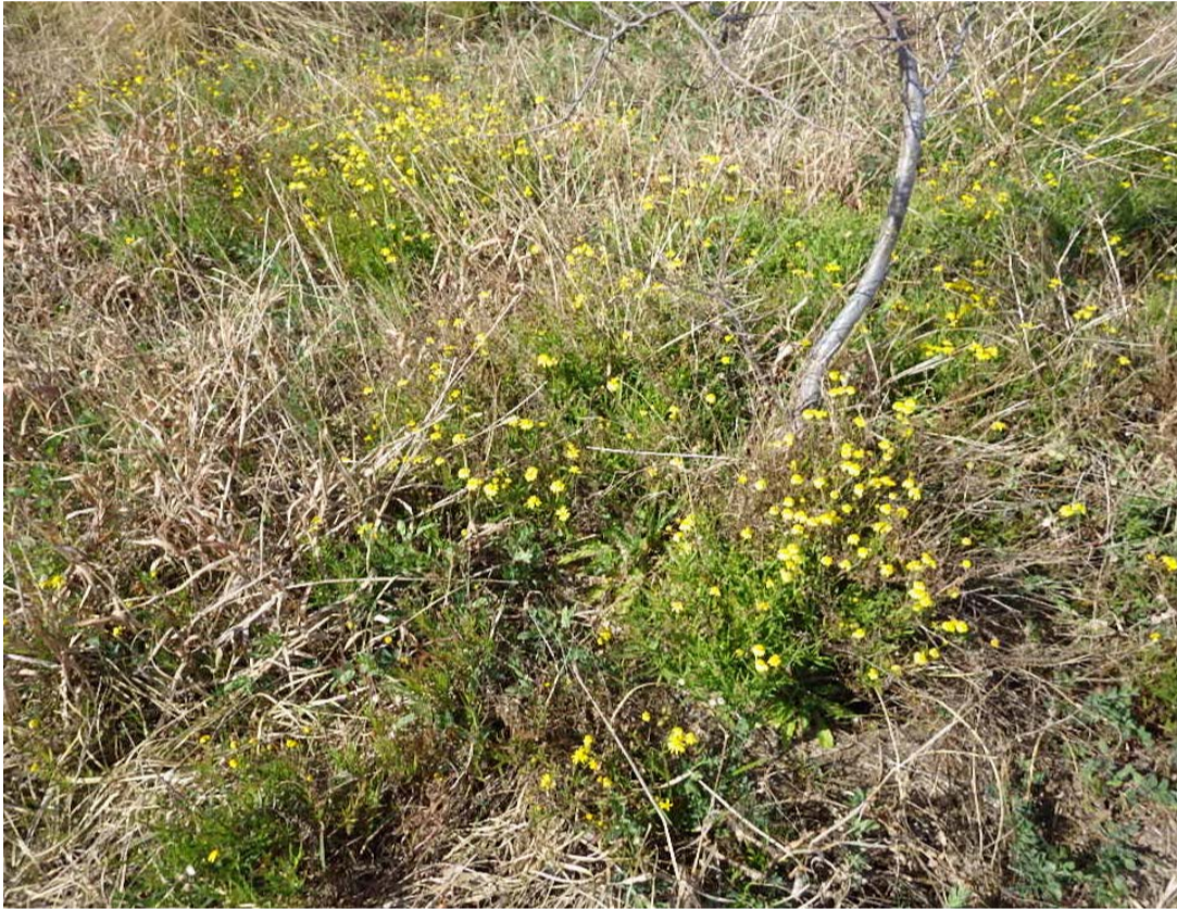
吉野川河口干潟(ナルトサワギク繁殖状況)

そこで吉野川のかかえる環境の問題点を知っていただくとともに、地域の皆さんの力を借りてナルトサワギクの抜き取りによる駆除作業を行い吉野川河口干潟の海浜植物などを守るため、吉野川現地(フィールド)講座を開催します。