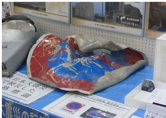
損傷した小型標識「駐車禁止」